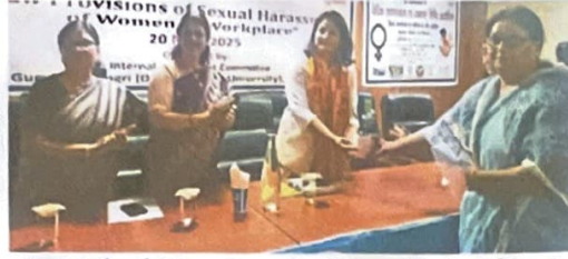
गुरुकुल कांगड़ी समविधि में जागरूकता कार्यक्रम के दौरान अतिथि को सम्मानित करते हुए