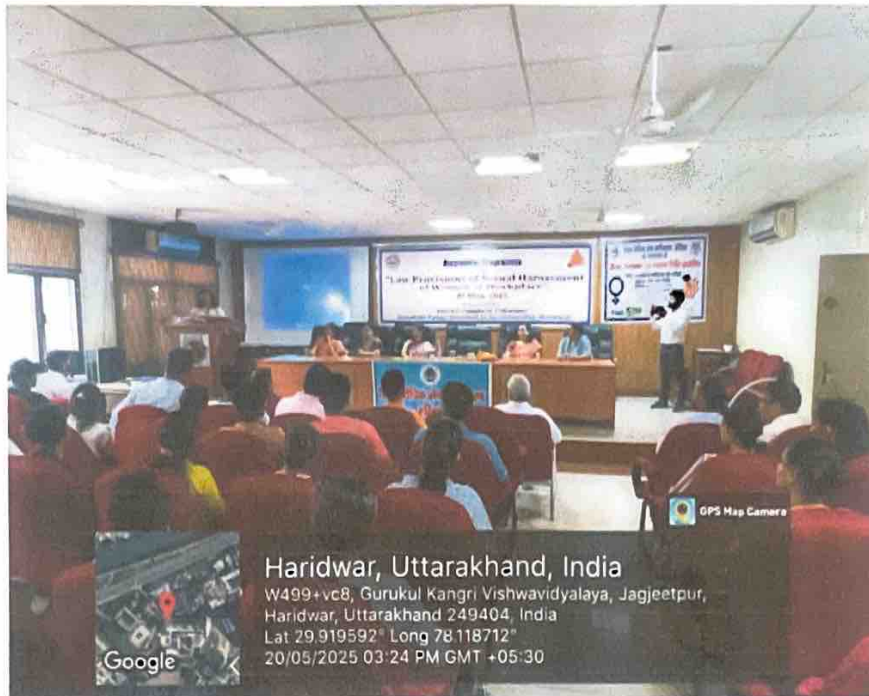
Haridwar, Uttarakhand, India W499+vc8, Gurukul Kangri Vishwavidyalaya, Jagjeetpur, Haridwar, Uttarakhand 249404, India Lat 29.919592° Long 78.118712° 20/05/2025 03:24 PM GMT +05:30