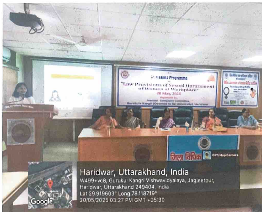
Haridwar, Uttarakhand, India W499+vc8, Gurukul Kangri Vishwavidyalaya, Jagjeetpur, Haridwar, Uttarakhand 249404, India Lat 29.919603° Long 78.118719° 20/05/2025 03:27 PM GMT +05:30