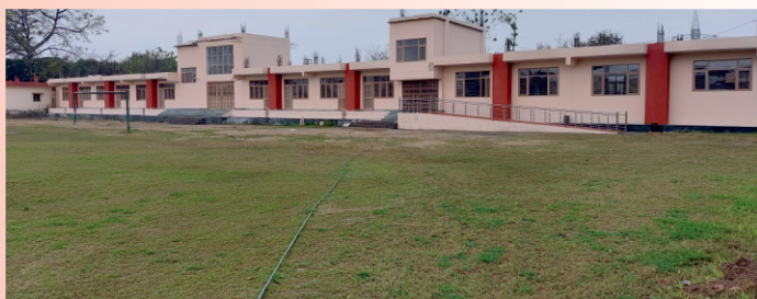
Hostel @ FET Campus