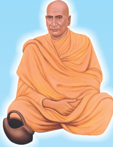
स्वामी श्रद्धानन्द जी Swami Shraddhanand Ji (1856-1926)

“गुरुकुल की स्थापना का उद्देश्य भारतीय संस्कृति का उन्नयन तो है ही साथ ही छात्रों को अनुशासित वातावरण में सर्वांगीण विकास और रोजगार परक शिक्षा देना भी है।”